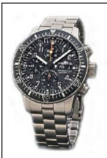
Fortis B-42 Cosmonaut Cronografo Limited Editino